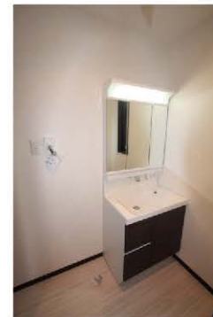
嬉しい3面鏡の洗面化粧台