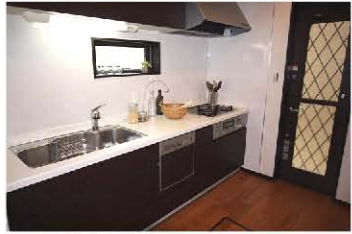
使い勝手とことんこだわったシステムキッチン♪ 勝手口を設置し生ごみなども室内を通ることなく捨てる事が出来ます。