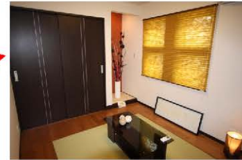
リビングから続き間の5帖超の 和室をご用意しました。 ゲストルームなどにお使い下さい。