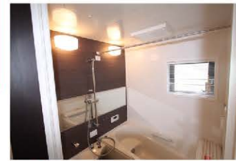
2階に水廻りを配置することで 忙しい奥様の洗濯の負担も 軽減されます。