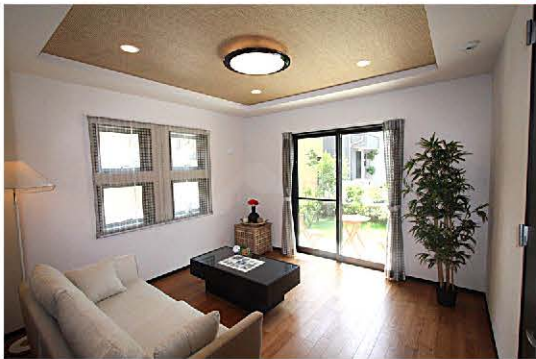
家具を配置することで 実際の生活のイメージも浮かんできます。 リビングからお子様の成長・緑を楽しんで下さい。