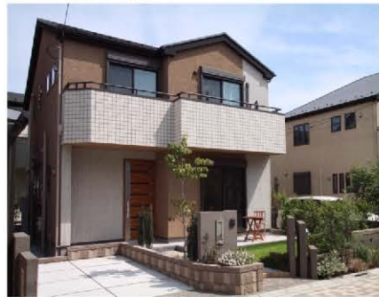
陽当たりさんさんな南道路に面した邸宅。 広いお庭が魅力な1邸です♪