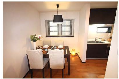
キッチンからの動線を考慮し 回らんのダイニング空間をご用意。