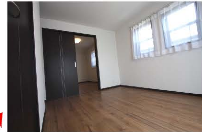
2部屋を合わせると 12.25帖の大きな洋室が誕生。